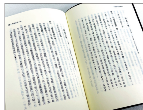
《御書文白並列本 別冊》中文版發行，收錄〈御義口傳〉及〈御講聞書〉重要御書。

書)的中文白話文版，相信這將大大增進全世界華人會員對於『南無妙法蓮華經』、《法華經》之正確理解，更能深化大家的信心。」