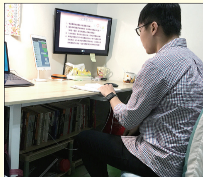
高雄中區建功支部男子部/6.26

線上座談會氣氛熱絡、笑聲不斷，大家紛紛表示：「台語發音的影片超用心」、「在國外工作，還可以參加線上座談