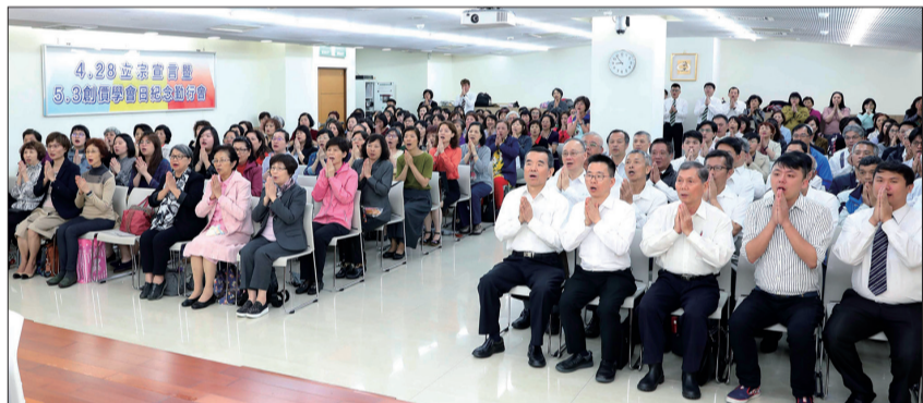
實踐每天早晚的自我偈勤行、唱題，能激發出生命無限可能性。