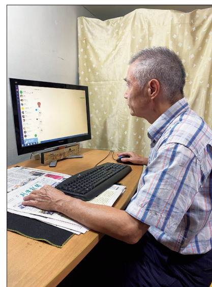
永和區三民地區壯年部/7.24

「澎湖兩兄弟為廣布、家庭共戰的體驗好感人！」內容充實的座談會，獲得各地會員的大力稱「讚」！