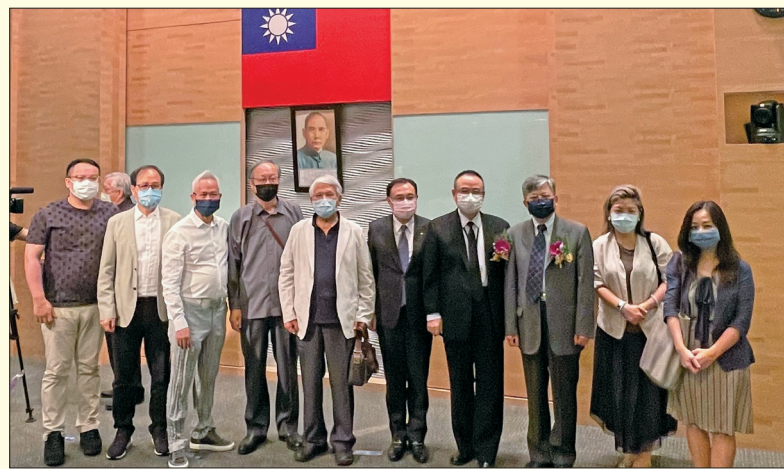
國美館舉行館長交接儀式，文化部次長蕭宗煌(右4)、新任館長廖仁義(右3)等人與創價美術館館長洪玉柱、副館長呂慧甄、林志銳合影。

年來積極推動「重建臺灣藝術史計畫」及美術園區升級等重要工作，過去也曾與創價共同舉辦「在現場：卡帕百年回顧展」、「日本浮世繪—東京富士美術館典藏精選展」、「花