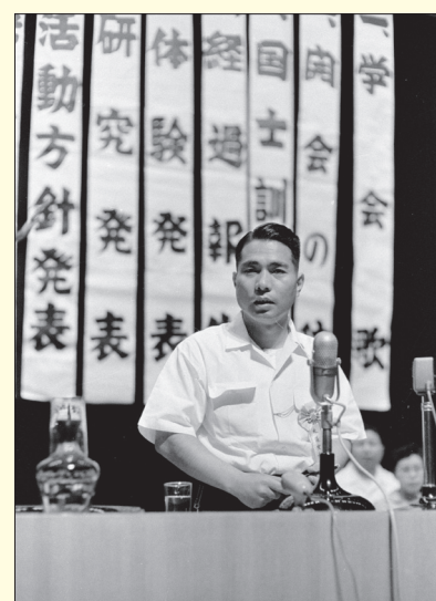
1958年6月29日，池田先生出席第1回學生部總會，勉勵大家：「勇於接受學習、挑戰的人，才是新時代最優秀的領導者。」

工會不僅對大人，就連孩童都加以霸凌，當時的會員如此記述：「我們被別人在背後批評、欺負，其實不是那麼痛苦，然而，每當看到孩子們因為遭到排