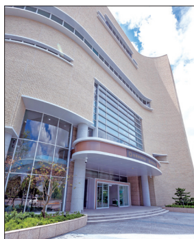
高雄文化會館外觀