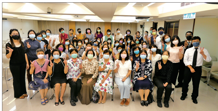
高雄一團歡喜舉辦創價教育實踐大會/9.18