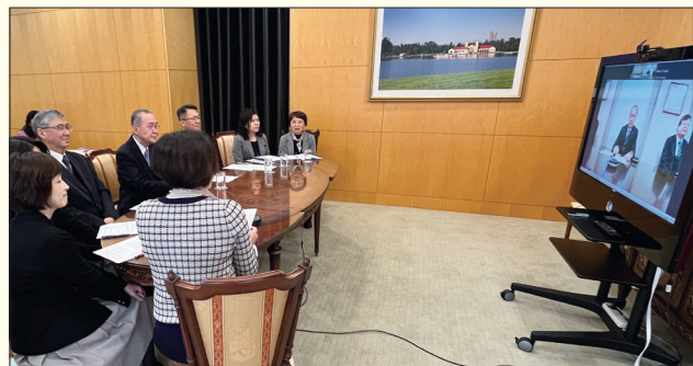
《御書文白並列本》委員會召開線上會議

並說：「學會本部已經正式以此《文白並列本》作為創價學會版《御書》，期使之普及於世界華語圈之中文使用人士，台灣與日本將一同攜手來