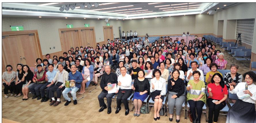
兩場講座包括導覽員、設計界專家學者及相關科系師生踴躍參加

讓國內外設計領域學者、莘莘學子及社會大眾，從不同面向、論述觀點及圖片，來了解台灣美術設計發展的面貌。