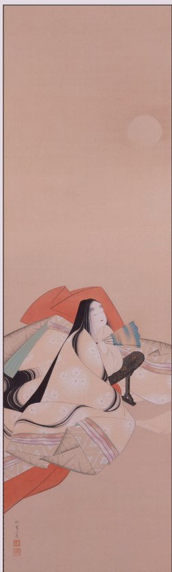
上村松園《紫式部之圖》 1921年(大正10年) 左右 絹本著色 二階堂美術館收藏