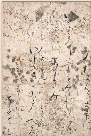
傳寂蓮《源氏物語繪卷詞書斷簡(松風段)》 平安時代、12世紀 彩箋墨書書藝文化院 春敬紀念書道文庫收藏 ※於展覽前期展出

「源氏繪」國寶《源氏物語繪卷》中看到。這項展覽不僅展出部分平安時代的美術、工藝品，並同時呈現臨摹本及重新製作的服裝，呈現王朝文化的特色。