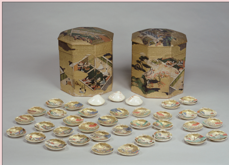
《源氏繪彩色貝殼桶》 江戶時代、17世紀 木製漆器 東京國立博物館收藏