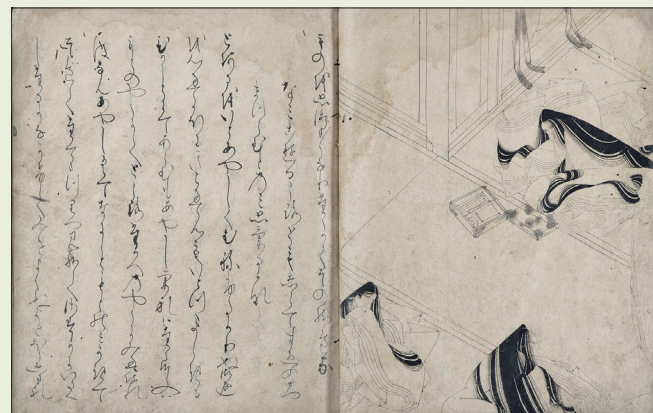
重要文化財 《源氏物語繪詞》 鎌倉時代、13世紀 紙本墨畫 大和文華館收藏 ※於展覽前期展出