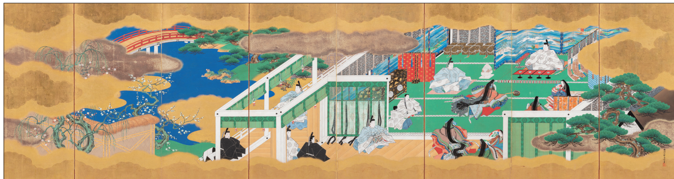
重要文化財 狩野晴川院養信《源氏物語圖屏風》 江戶時代、1826年(文政9年) 紙本金底著色 法然寺收藏 【圖為左幅】

日本女作家紫式部著作的《源氏物語》自平安時代中期完成創作以來，一直代代相傳，至今仍廣受讀者喜愛。故事以主角光源氏為主軸，生動描繪了當時貴族社會的繁華及風流韻事，它的影