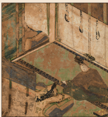
首次公開《源氏物語小畫宣板宿木》 平安時代、12世紀 紙本書宣板 私人收藏

「源氏繪」國寶《源氏物語繪卷》中看到。這項展覽不僅展出部分平安時代的美術、工藝品，並同時呈現臨摹本及重新製作的服裝，呈現王朝文化的特色。