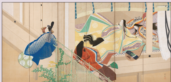
松岡映丘《宇治宮的公主們》 1912年(大正元年) 絹本著色 姫路市美術館收藏 【上圖為左幅、下圖為右幅】