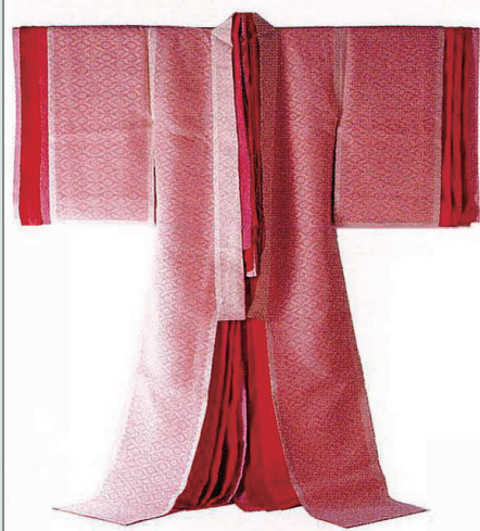
吉岡幸雄《若菜上 女三之宮(紅梅上衣與櫻花便和服)》 2008年(平成20年) 絹、染料 染司吉岡收藏/©紫紅社

除了上述四個展區的展覽內容之外，同時呈現現代創作家的工藝品、文學、漫畫等，探索現代「源氏文化」的面貌。