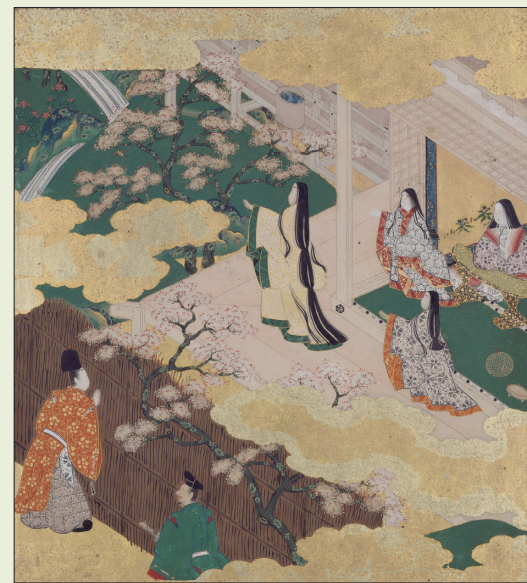
重要文化財 繪畫 土佐光吉/詞 青蓮院尊純 其他 《源氏物語畫帖》 桃山時代、17世紀 紙本金底著色 京都國立博物館收藏 ※展覽前期會更換場景

《源氏物語》以多種形式進行創作，除了繪卷、手冊之外，還有扇面、畫宣板、屏風等。此次展覽將隨著54章節來介紹各種「源氏繪」，包括土佐派、住吉派的畫冊、卷與畫宣板等作品。