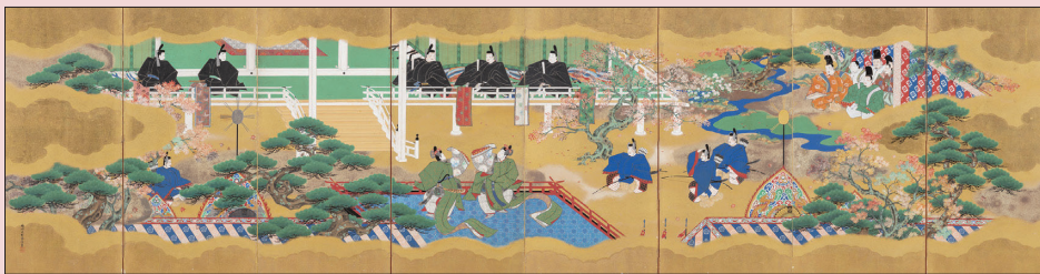
重要文化財 狩野晴川院養信《源氏物語圖屏風》 江戶時代、1826年(文政9年) 紙本金底著色 法然寺收藏 【圖為右幅】

屏風上描繪一個場景或兩至三個場景組合的屏風。「源氏繪」的圖樣與特色也融入了工藝設計。本展區介紹以《源氏物語》為主題的漆器作品，並探討《源氏物語》超越流派的擴展。