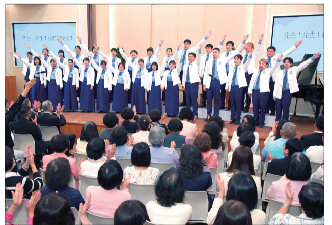
創價青年合唱團唱出充滿生命力的歌聲