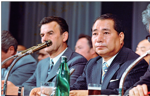
1975年5月，池田先生（右）在莫斯科大學演講。