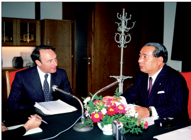
1981年5月26日，池田先生前往蘇聯、歐洲、北美訪問時，在維也納與威爾遜博士會談。

價大學與東亞研究所之邀到日本進行學術參訪，與池田先生在日本首次會面，之後，兩人時而在日本、時而在歐洲會面，並歷經長時間的書信往來，終於出版了這本對談集。