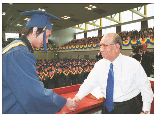
2003年3月，在東京創價學園的畢業典禮，創辦人池田先生與畢業生握手，給予鼓勵。