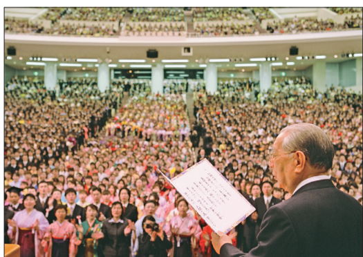
2003年3月，於創大池田紀念講堂，池田先生在創大、創價女子短大的畢業典禮，與學生一同高唱〈學生歌〉。