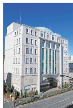
池田先生創辦的民主音樂協會（東京信濃町，左圖）、東京富士美術館（東京八王子市，下圖）。

1963年創辦民主音樂協會（民音），1983年設立東京富士美術館。民音的海外交流，如今已達到112個國家、區域，吸引超過