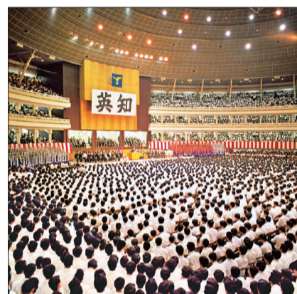
池田先生於大學部總會鼓勵學生（1968年9月，於東京日大講堂）