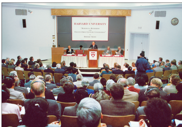
1993年9月，池田先生應哈佛大學之邀，以「21世紀文明與大乘佛教」為題，在該校第二次演講。

此外，為了從民眾角度構築起世界與亞洲的和平橋樑，先生於1968年發表「日中邦交正常化倡言」，呼籲日本與中國兩國