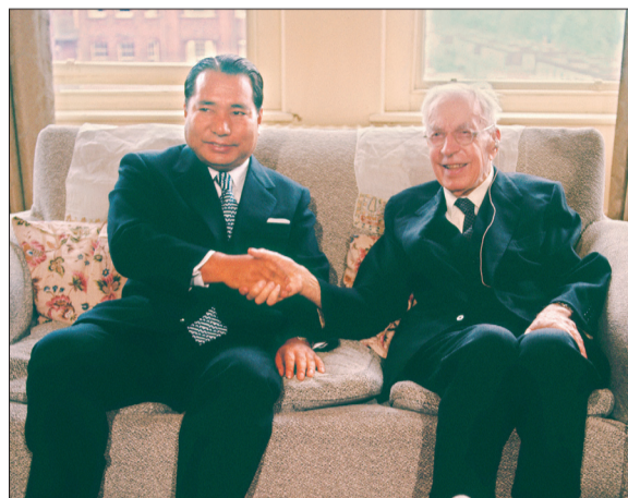
1973年5月，池田先生與歷史學家湯因比博士於博士的倫敦宅邸展開第二次對話。

讓「悲慘」二字從世界上消失——戶田先生託付給池田先生的誓願之火，如今正由世界各地的池田門生繼承。