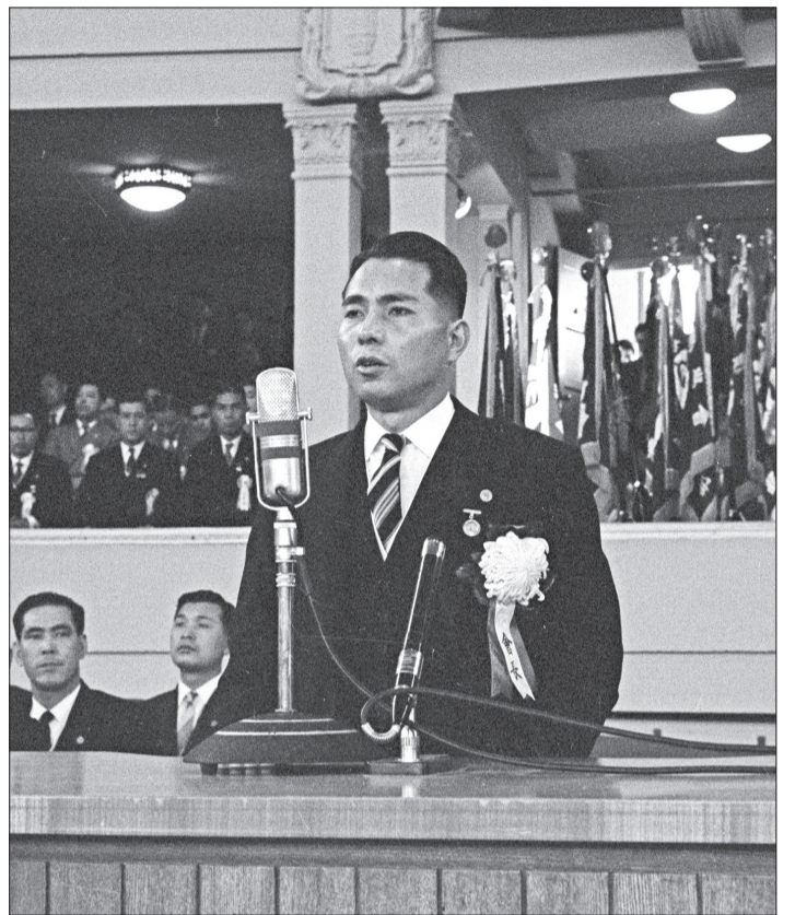
1960年5月3日，池田先生站在東京兩國的日大講堂講台上，發表就任演說。