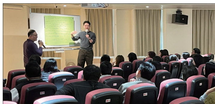
學員發表防災計畫實作成果，講師進行講評。(台北場/1.29)