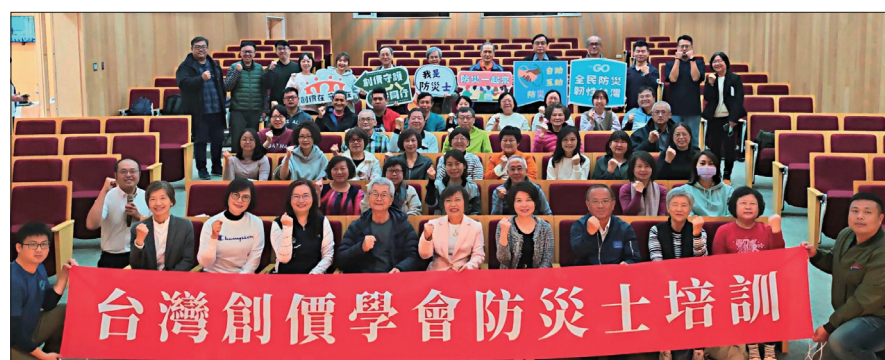
防災士培訓及認證課程(高雄場/1.31)

1月29日，前內政部長兼水利專家李鴻源蒞臨台北場次的培訓課程。他結合水利與佛法觀點，提出「防災即修行」的觀念，指出面對氣候變遷對人類生存所帶來的嚴峻挑戰，唯有從心靈改革與生活上的日常實踐著手，才能真正落實永續發展與社區防災。他呼籲宗教團體積極肩負起「宗教的社會責任」，透過教育、關懷