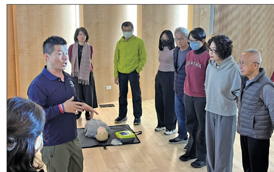
講師說明急救要點(高雄場/1.31)

1月29至2月1日的課程兼具理論與實務，涵蓋防災體系運作、社區避難收容及基礎急救演練