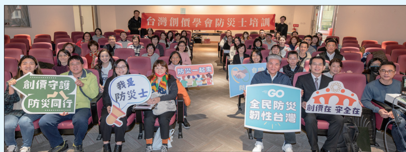
防災士培訓及認證課程(台北場/1.29)

等。此次，參與的學會員認真聆聽上課內容、參與實地演練，並參加學科及術科測驗，通過認證者可取得防災士資格，成為社區上防災應變的生力軍。