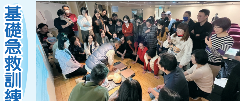
講師示範急救設施操作方式(台北場/1.30)