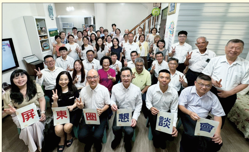
屏東圈幹部歡喜參與懇談會

代，創價更應發揮守護人性尊嚴、創造生命最高價值的力量。他期勉幹部以師匠池田先生為典範，懷著歡喜心不懈地